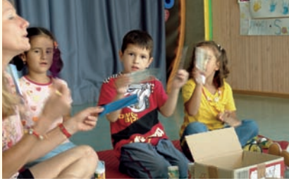
Çocuklar evcilik oynarlarken de yüksek sesle konuşabilirler. Buna izin verin.