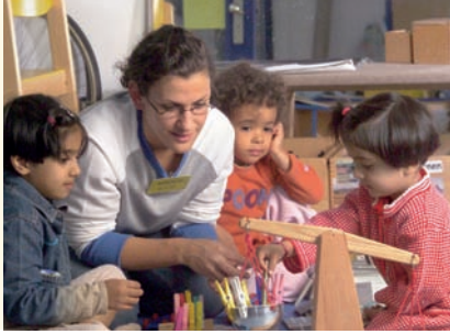
Çocuklar, sevildiklerini hissetmek ve emin olmak isterler.

Çocuğunuzun yeni bir şey öğrenmesi zihinsel bir başarı demektir. Bu nedenle onu övmeniz ve takdir etmenizi hak eder ve bekler. Eğer o anda zamanınız yoksa bunu çocuğunuza söyleyin ve kendisine sebebini açıklayın. O zaman çocuğunuz bunu daha kolay kabul edecektir. Çünkü çocukları avutup bekletmek kendilerinde güvensizlik yaratır. Verdiğiniz sözleri tutun!