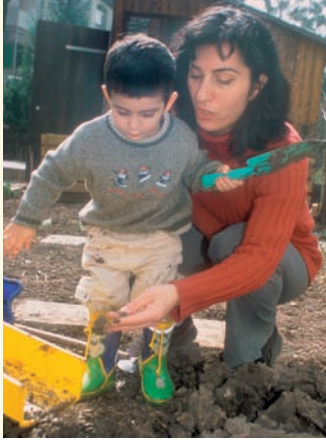
Çocuğunuzun kendini kirlletmesine izin veriniz.