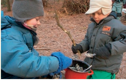
Yaklaşık üç veya dört yaşında ikinci soru sorma dönemi başlar.